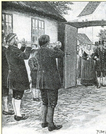
Brudetoget kommer til gården.

Man må ikke tro, at fordi de kaldtes 'drenge', så var dette musikkorps sammensat af unge kræfter. Næh, det var ældre mænd, hvilket kunne ses på deres barkedede næver, og den tilgivelige tung- heds, der lagdes i buen, når strygeinstrumenterne skulle trakteres. Det var et privilegeret korps, der på amtsstuen havde erlagt den afgift, der var bestemt for at blive medlem deraf. Man siger, at denne institution skriver sig fra den tid, da Ærø var udparcelleret til gud ved hvor mange Slesvig-Holstenske, Plönske, Got- torpske osv. hertuger, til hvilke der betaltes skat.